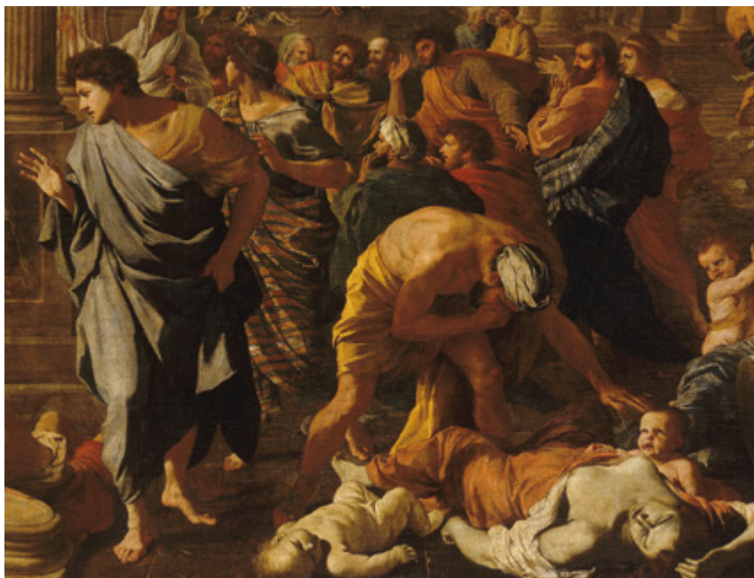
Détails Peste d'Asdod Nicolas Poussin 1630-1631 musée du Louvre

MAISON DE LA RECHERCHE (BÂTIMENT F), SALLE DES COLLOQUES UNIVERSITÉ DE LILLE, CAMPUS PONT-DE-BOIS VILLENEUVE D'ASQC